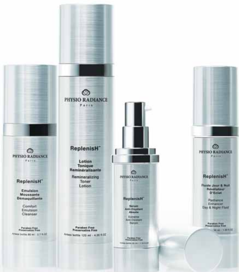
Comfort Emulsion Cleanser