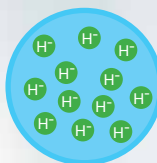
內含H - 的疏水球

為避免水與負氫的接觸，Physio Radiance採用專利微粒膠囊技術，將負氫保護在小型疏水球內。我們並使用特別為Physio Radiance產品研發的泵浦機制，將這些疏水球壓碎，讓您在塗抹護膚品的前一刻才釋放負氫。在此情況下，負氫將發揮完整的功效。